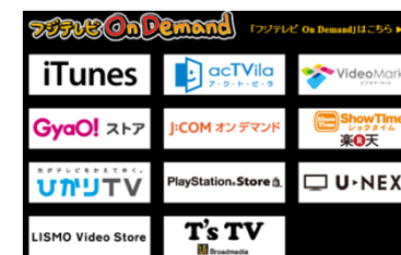
映画有料配信パートナー