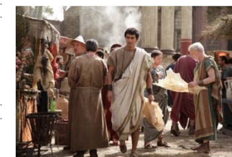
テルマエ・ロマエ