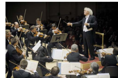
ベルリン・フィルハーモニー 管弦楽団