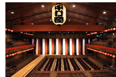
平成中村座 十一月大歌舞伎